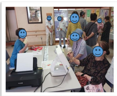
作野福祉センター祭り

2025年には、65歳以上の高齢者の5人に1人が認知症になると言われており、認知症は身近な病気になってきています。