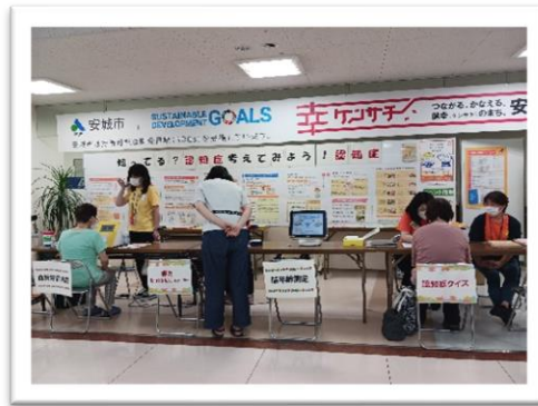
アンディヤマナカ 新安城店