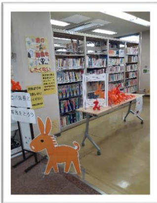
作野公民館こども夏まつり

アルツハイマー月間の9月、地域にて認知症啓発活動を行い、多くの方にご参加頂きました。左のイラストにあるオレンジのロバは、認知症啓発のマスコット『ロバ隊長』といいます。ロバ隊長が認知症啓発のマスコットであるゆえんは、ロバのようにゆっくりと一步一步着実に歩みを進めるという意味が込められています。地域包括支援センター八千代では、これからも認知症について地域の方に知っていただけるよう、地域の方々と一緒に一步一步着実に啓発活動を進めていきます。イベントの際は、是非ご参加ください。